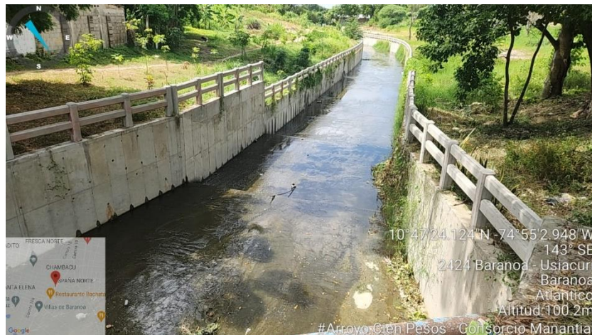
Foto N° 1 Fecha: 27 de julio 2023 Ubicación: Municipio de Baranoa, Atlántico. Observaciones: Punto inicial de Arroyo Cien Pesos Sector 2.

“POR MEDIO DE LA CUAL SE DAN POR CUMPLIDAS LAS OBLIGACIONES IMPUESTAS MEDIANTE LA RESOLUCION No. 367 de 2022 Y SE ORDENA EL CIERRE Y ARCHIVO DEL EXPEDIENTE No. 0129-293 DEL CONSORCIO MANANTIAL 2022, IDENTIFICADO CON NIT 901.564.442-0”