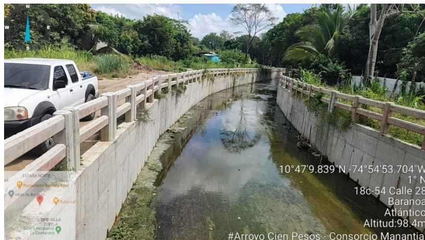
Foto N° 2 Fecha: 27 de julio 2023 Ubicación: Municipio de Baranoa, Atlántico Observaciones: Punto intermedio Arroyo Cien Pesos Sector 2.